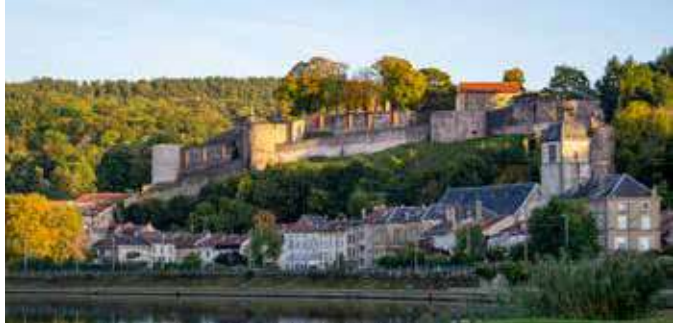
Château de Sierck automne

En fin de journée, visite d'une brasserie artisanale avec dégustations