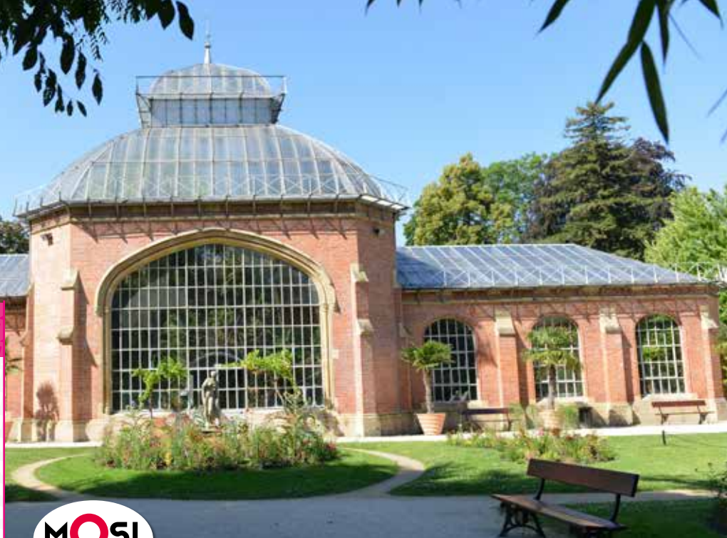
Jardin botanique - Metz