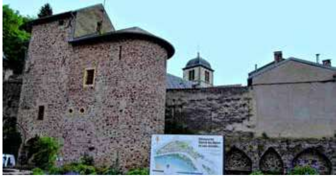
Tour de l'horloge

Trois Frontières Tourisme Beatrice LONG 3 place Jean de Morbach 57480 SIERCK LES BAINS 03 82 83 74 14 officedetourisme@ccb3f.fr www.troisfrontierestourisme.com