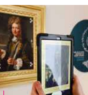
Musée du Sel - Marsal