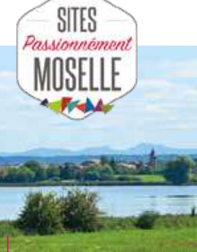
Domaine de Lindre