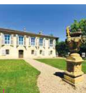
Maison de Robert Schuman - Scy-Chazelles