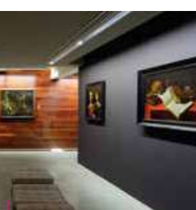
Musée Georges de La Tour - Vic-sur-Seille