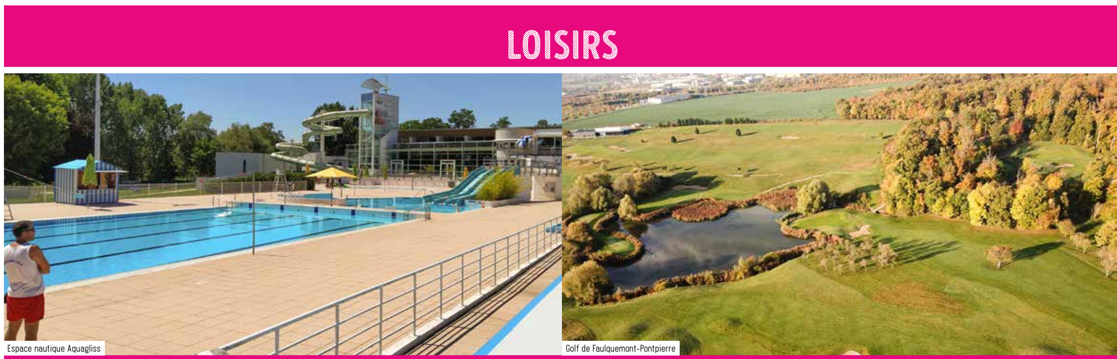
Espace nautique Aquaglis