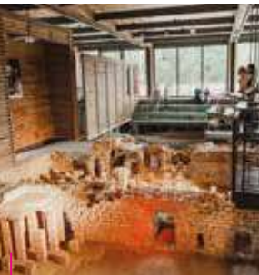
Parc archéologique européen de Biesbrück-Reinheim