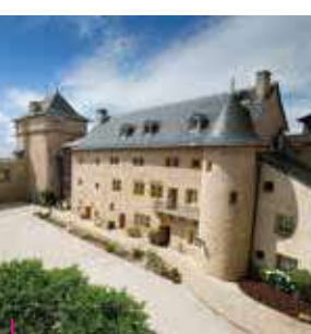
Château de Malbrouck - Mandern