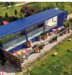
Les Jardins Fruitières de Laquenexy