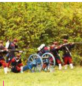
Musée de la Guerre de 1870 et de l'Annexion - Gravelotte