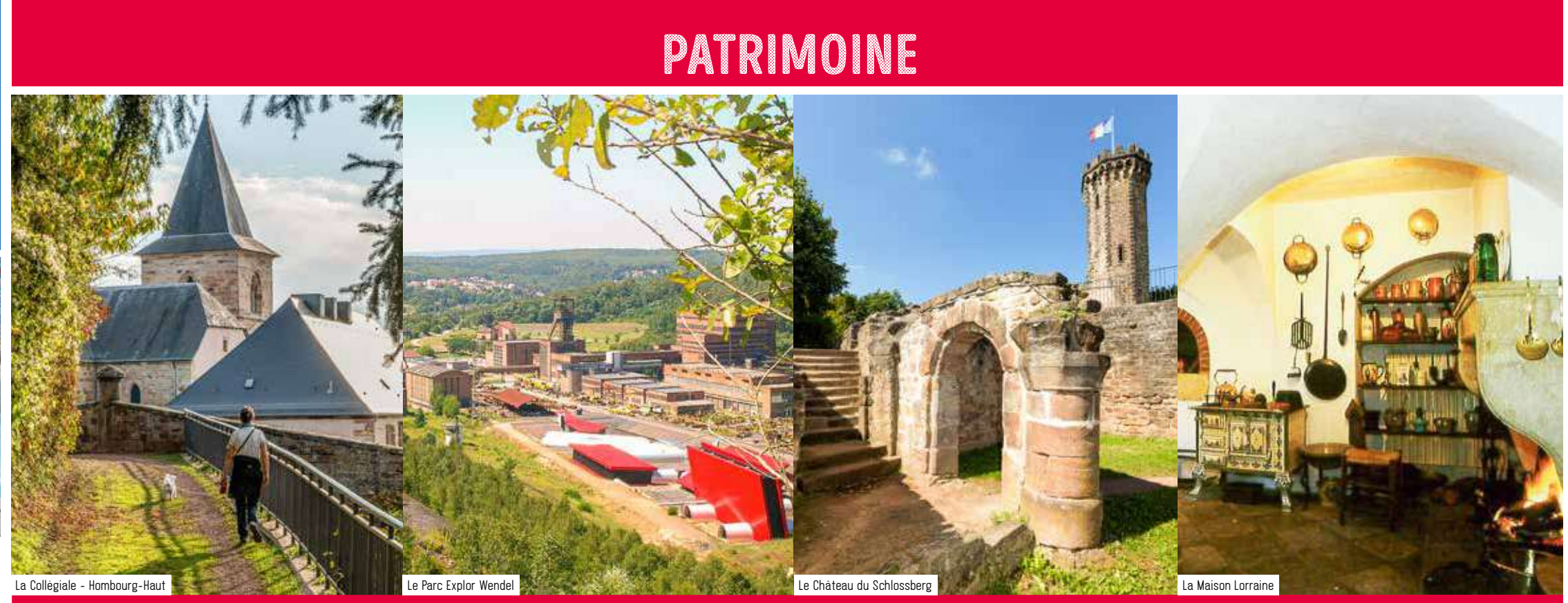
La Collegiale - Hombourg-Haut