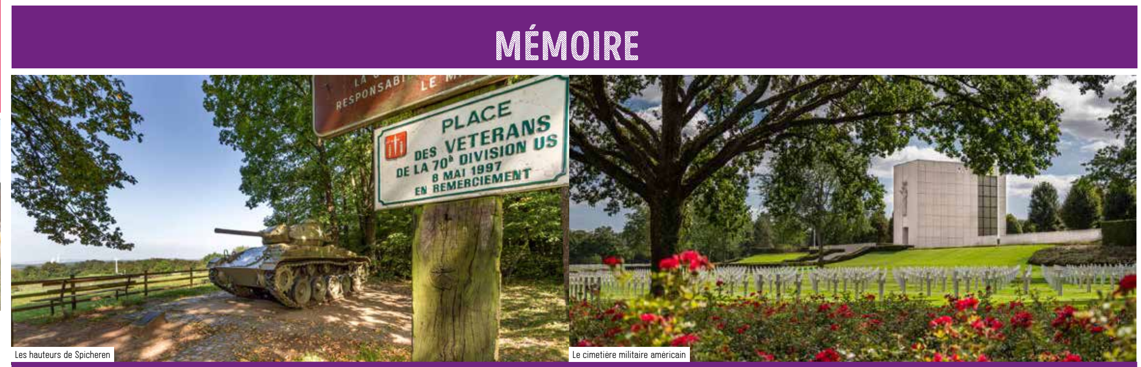
Les hauteurs de Spicheren